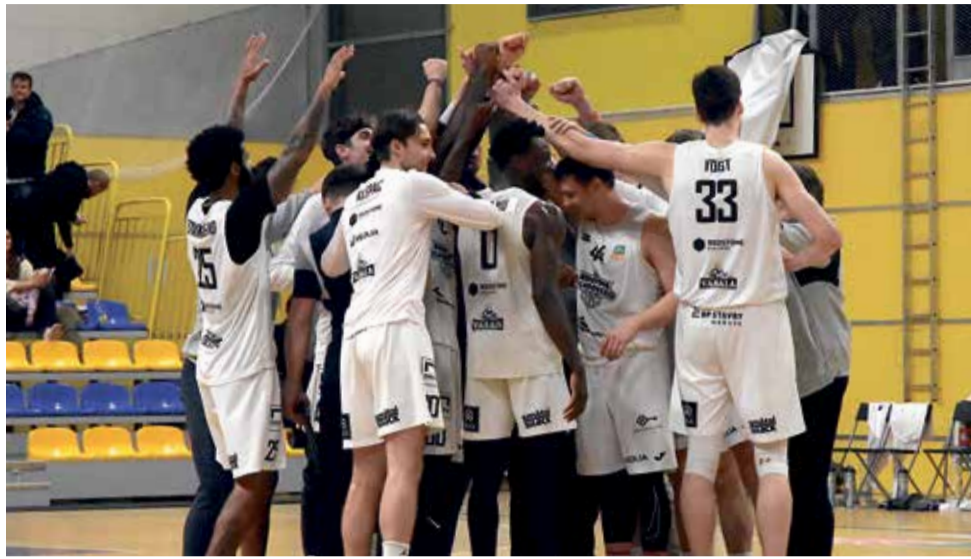
Basketbalisté BK REDSTONE Olomoucko se poprvé probíjeli do play-off.

S lehkým odstupem začíná vedení BK REDSTONE Olomoucko hodnotit třetí sezonu klubu v Kooperativa NBL. Byla poměrně turbulentní. V závěru základní části to vypadalo, že tým může skončit v baráži a bude bojovat o udržení. Po velkém obratu se ale dostal přes předkolo až do čtvrtfinále vyřazovací části. „Oproti předchozím sezonám je to výrazný posun dopředu. Pozitiva rozhodně převládají,“ řekl Libor Špunda, generální manažer BK REDSTONE.