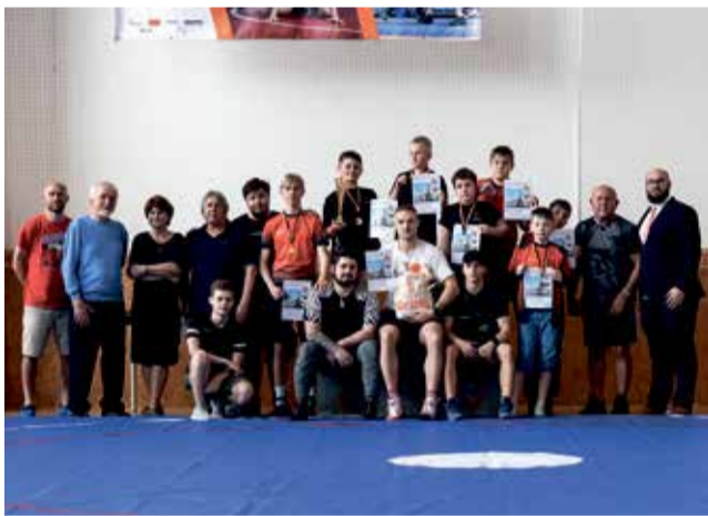
Členové Wrestling Clubu Olomouc získali osm medailí.