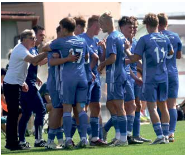
Devatenáctka SK Sigma vyhrála na hřišti lídra tabulky.