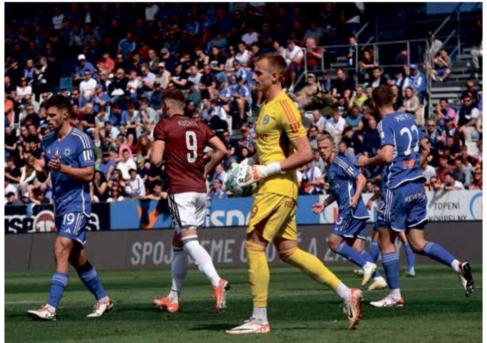
Fotbalisté SK Sigma Olomouc semifinále play-off s Hradcem Králové nezvládli a mají po sezoně.