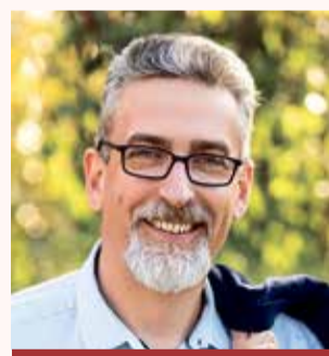
Mirek Žbánek primátor

Ptejte se vedení města Olomouce na e-mailové adrese otevrenaradnice@hanackyvecernik.cz a my Váš dotaz necháme zodpovědět!