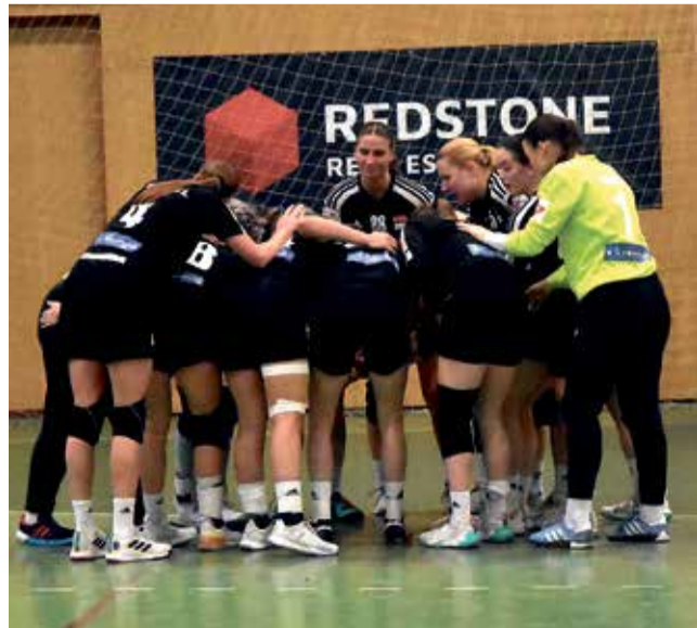
Házenkářky DHK Zora Olomouc se se soutěžním ročníkem rozloučily vítězně.