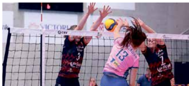
Volejbalistky VK Prostějov už mají hotový kádr na novou sezonu.

či univerzální Adéla Sofková. Příležitost ovšem dostanou i některé další mladé holky, a to po domluvě s šéftrenérem naší mládeže Alešem Novákem na začátku tréninkového procesu.“ podotkl Čada. ■ pel