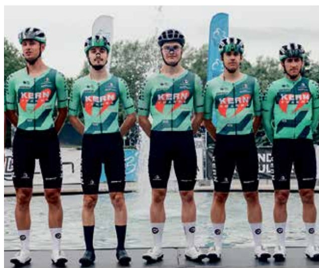
Cyklistickou Czech Tour pojede další špičková stáj.

Fanoušci se tak mohou těšit na další tým, který nepřijede pouze vyplnit startovní listinu. Equipo Kern Pharma má za sebou výsledky, které vzbudily respekt celého pelotonu, a na Czech Tour může znovu potvrdit, že patří mezi nejoblíbenější ProTeamy současnosti. Srpnový závod tak získává další příslib atraktivní, otevřené a útočné cyklistiky.