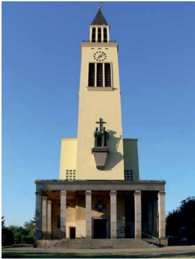
Kostel sv. Cyrila a Metoděje v Hejčíně.

Metoděj byl v Římě na podzim roku 869 vysvěcen papežem Hadriánem II. na arcibiskupa moravsko-panonského, přičemž jeho hlavní působnost se soustředila právě na Mora-