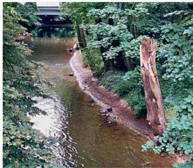
Zdroj: Michal Folta

O něco lepší je situace stojatých uzavřených vodních ploch, kde