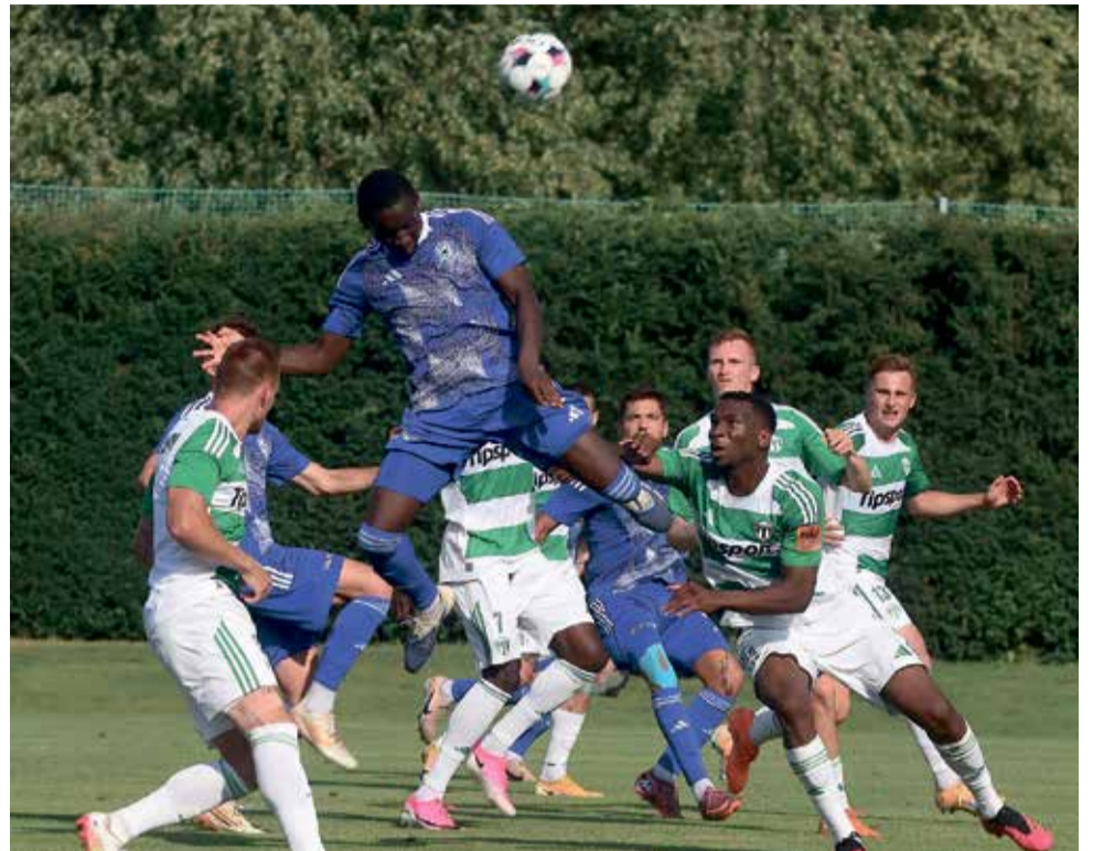
Fotbalisté SK Sigma Olomouc jsou v přípravě zatím bez prohry, nyní je čeká soustředění.

SK Sigma: Stoppen (46. Berka) - Siegl, Spáčil, Jadrníček - Mikulenka, Janošek, Jezierski (46. Mikaelsson), Dolžnikov (46. Fiala) - Grgič, Rúsek, Šíp (46. Kliment). Trenér: Pavel Hapal.