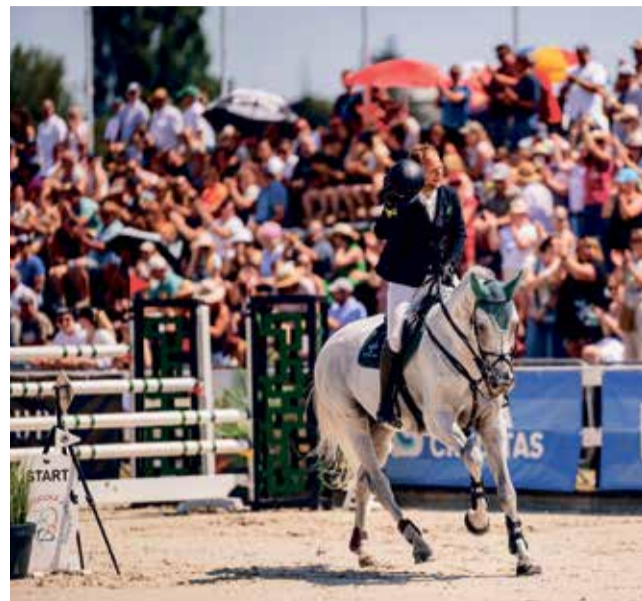
V Olomouci se opět sejde evropská drezurní špička.

Sportovní program mistrovství Evropy dětí a juniorů v drezuře probíhá v Equine Sport Center od středy 15. července. První závodní den odjede své úlohy nejprve první polovina dětí v rámci takzvaného předkola a od 13:00 hodin i první část juniorů v týmové soutěži. Podobný scénář bude mít čtvrtek, kdy se po 18. hodině